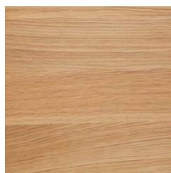
MÓVEL LAVATÓRIO I.S.: ACABAMENTO IMITAÇÃO CARVALHO