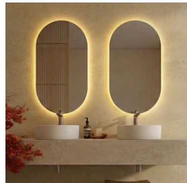
Espelho rectangular, com iluminação: