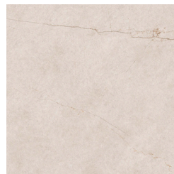
CERÂMICO - ROCA 120X280 MARBLE CREMA DELICATO ARENA

PERSONALIZAÇÃO // ACABAMENTOS ANDAR MODELO - GREEN HILLS