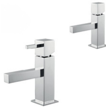
Monocomando ASM Taps, modelo Quadra (ref. QUAD011R)