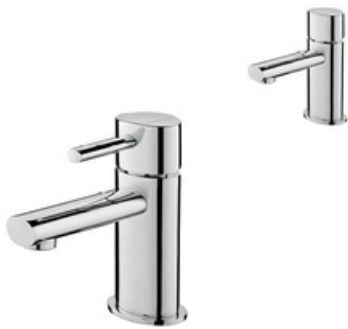
Monocomando ASM Taps, modelo Oval (ref. OVAL011R)