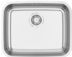
Stainless steel sink: individual bowl Rodi Belém