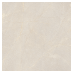
CERÂMICO - ARGENTA SERRA CREAM POLISHED 60X120 | REF. 8435592046587