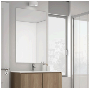
Espelho rectangular, sem iluminação: